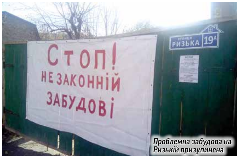
Проблемна забудова на Ризькій призупинена

З минулого року, в Шевченківському районі столиці, на вулиці Ризькій, 19-а, триває протистояння місцевих мешканців та забудовника, який, порушуючи чисельні будівельні норми та правила, вирішив побудувати багатоповерхівку посеред приватних будинків. Так і не отримавши жодних пояснень, люди вимушені були перейти до радикальних дій: зламали паркан, а потім власноруч зупинили будівельний кран.