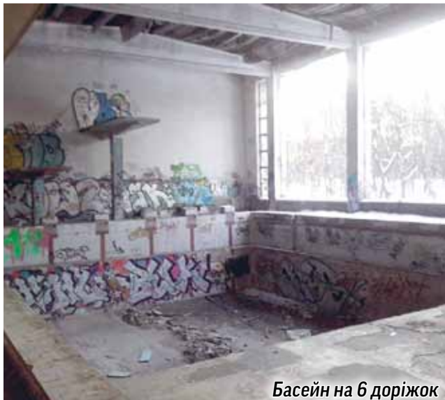
Басейн на 6 доріжок

ність. З цією метою створюємо ініціативну групу по збору підписів, що дасть можливість розглянути дане питання на сесії Київради. Будемо сподіватися на позитивне вирішення питання щодо повернення басейну «Чайка» нашим мешканцям».