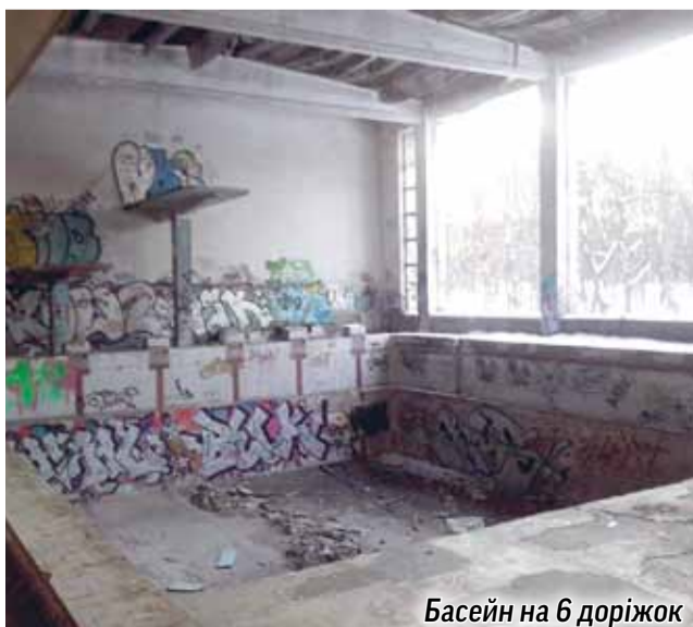
Басейн на 6 доріжок

ність. З цією метою створюємо ініціативну групу по збору підписів, що дасть можливість розглянути дане питання на сесії Київради. Будемо сподіватися на позитивне вирішення питання щодо повернення басейну «Чайка» нашим мешканцям».